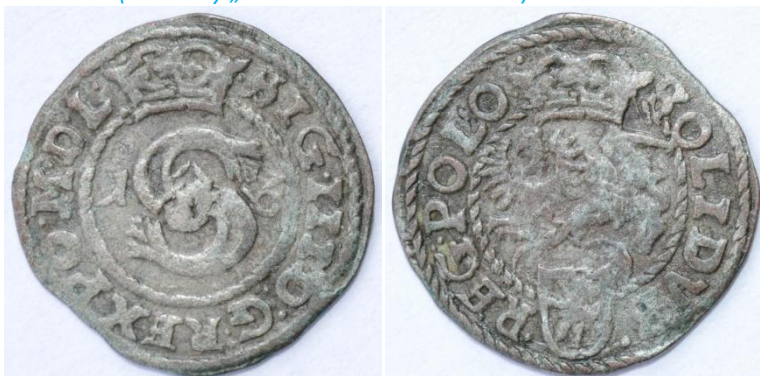
1600-I-6-a (bez litery „F” – Wschowa lub Poznań)

Av.: Monogram „S”, Snopek, po bokach 1 – 6, korona. Napis w otoku: SIG III D G REX PO M D L