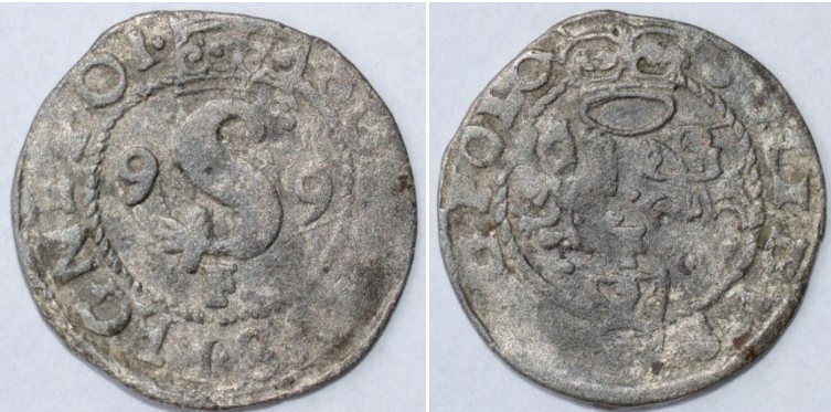
1599-II-4-b (brak imienia króla w napisach otokowych)

Av.: Monogram „S”, po bokach 9 – 9, u góry korona, u dołu „F”. Napis w otoku: SOLIDVS REGNI POL