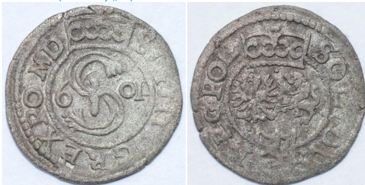
1601-I-3-a (bez litery „F”)

Av.: Monogram „S”, Snopek, po bokach 6 – 0I, u góry korona. Napis w otoku: SIG III D G REX PO M D