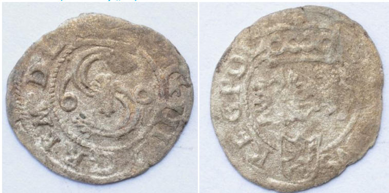
1601-I-3-c (bez litery „F”)

Av.: Monogram „S” ze Snopkiem, po bokach 6 – 01, korona. Napis w otoku: SIG III D G R P M D L