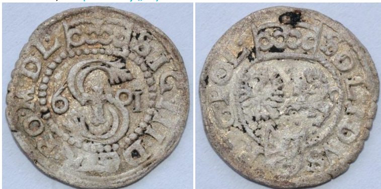
1601-I-3-b, w1 (bez litery „F”)

Av.: Monogram „S” ze Snopkiem, po bokach 6 – 01, korona. Napis w otoku: SIG III D G R PO M D L