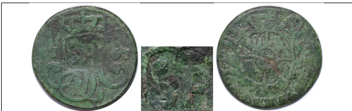
Żeton dominialny: grosz Stanisław August, Kraków 1767; kontrmarka – „SP” Miedź; średnica 20,5-21 mm; waga 3,22 g; kontrmarka: ok. 6,5 x 6,5 mm