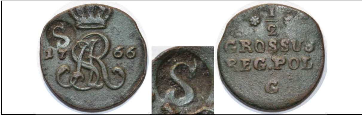
Żeton dominialny (Sapiehów lub Sanguszków?): półgrosz Stanisław August 1766; kontrmarka – „S” Moneta znaleziona w Słowikach Nowych (10 km od Kozienc) Miedź; średnica ok. 17 mm; waga 1,94 g; kontrmarka: 5 mm (wysokość) x 4,5 mm (szerokość) Boiko-Gagarin – 4