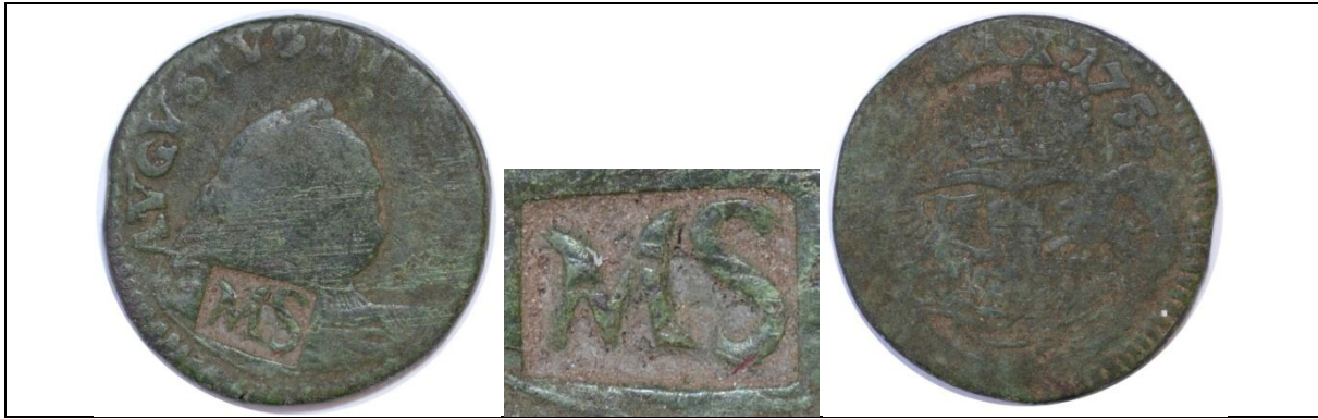
Żeton dominialny Sapiehów (Aleksander Michał Sapieha – kanclerz litewski ?): grosz August III Sas 1755; kontrmarka – „MS” Miedź; średnica ok. 19,5 mm; waga 3,67 g; kontrmarka: 6 x 4 mm Boiko-Gagarin – 3