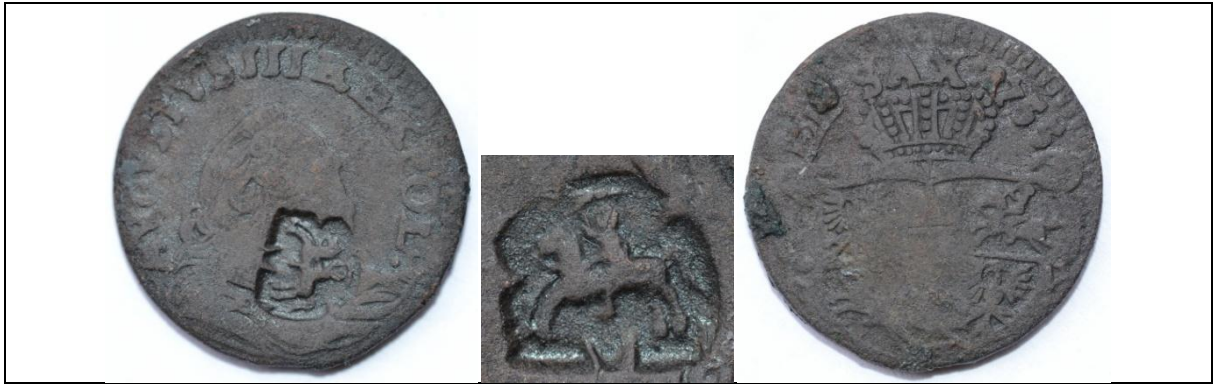
Żeton dominialny Sanguszków (lub Czartoryskich): grosz August III Sas 1755; kontrmarka – herb Pogoń Miedź; średnica 19 mm; waga 3,29 g; kontrmarka: 6 mm x 5 mm Boiko-Gagarin – 6