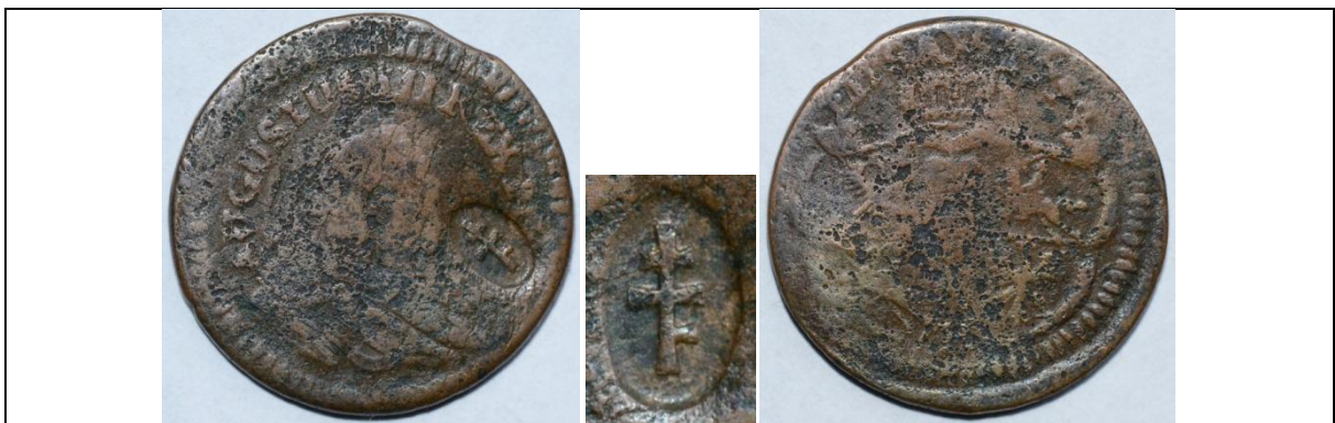
Żeton dominialny: grosz August III Sas, Gubin 1754; kontrmarka (być może współczesny falsyfikat) Miedź; średnica 21 mm; waga 3,73 g; kontrmarka: wys. 4 mm; szer. 3 mm