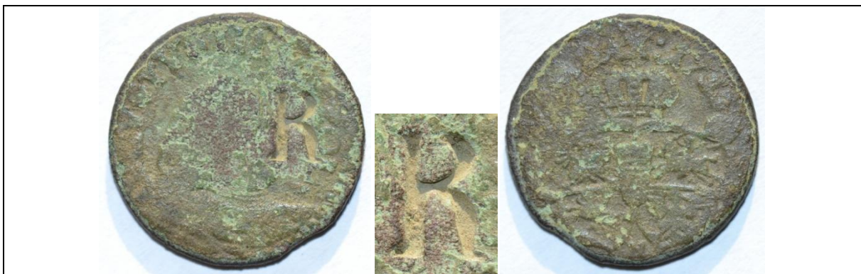
Żeton dominialny: grosz August III Sas 1755; kontrmarka – „R” Miedź; średnica 19 mm; waga 3 g; kontrmarka: 5 x 3 mm Boiko-Gagarin – 29 (podobna)