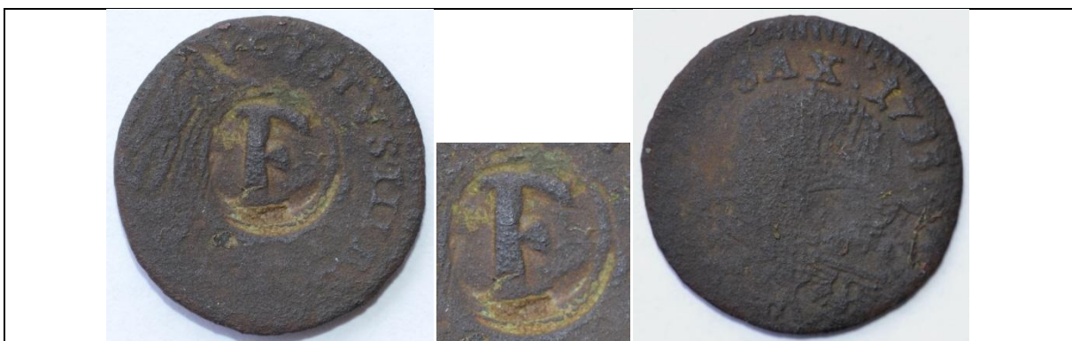
Żeton dominialny: grosz August III Sas 1755; kontrmarka – „F” Jeden z żetonów tego typu został znaleziony niedaleko miejscowości Śniadówka (ok. 20 km od Puław) Miedź; średnica 19 mm; waga 2,24 g; kontrmarka: 8 x 8 mm Boiko-Gagarin – 33