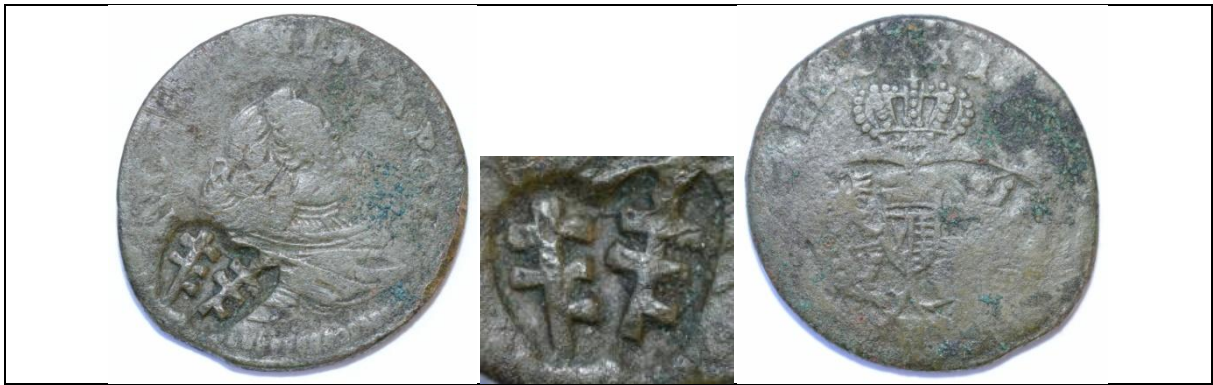
Żeton dominialny Potockich (Franciszek Salezy i Anna?): grosz August III Sas; kontrmarka – podwójny herb Pilawa Miedź; średnica ok. 21 mm; waga 3,74 g; kontrmarka: wys. 5,5-6 mm; średnia szer. 6 mm Boiko-Gagarin – 10